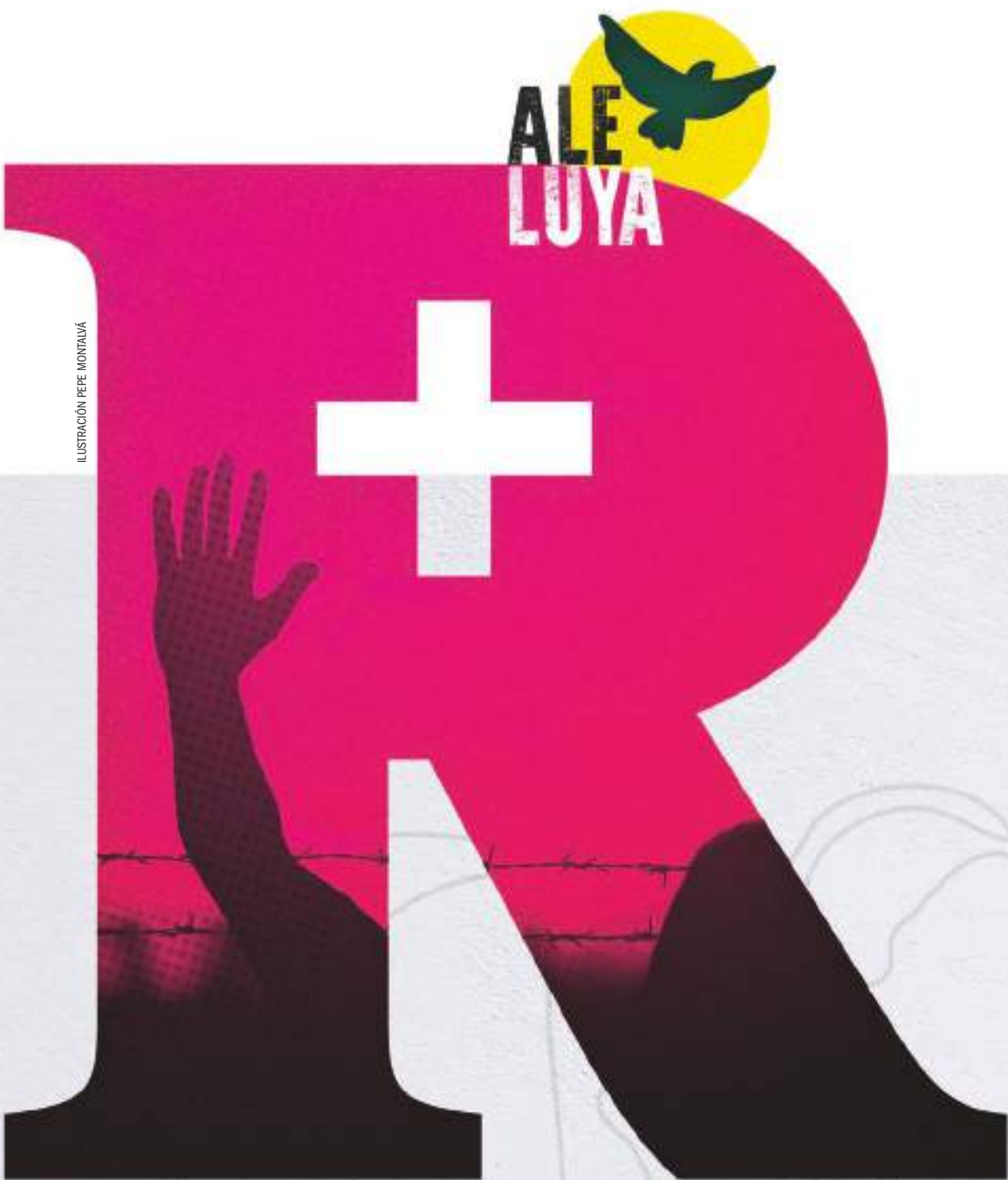
ILUSTRACIÓN PEPE MONTALVÁ

El Papa escribe en 'Vida Nueva' una reflexión inédita para una Pascua marcada por el coronavirus. A partir del "alégrense" de Jesús a las mujeres, reivindica la civilización del amor. Francisco llama a contagiarse con "los anticuerpos necesarios de la justicia, la caridad y la solidaridad" para la reconstrucción en el día después de la pandemia. "Es el Resucitado que quiere resucitar a la humanidad entera", asevera en esta hoja de ruta que el Obispo de Roma regala a los lectores de la revista, a la Iglesia y a la sociedad.